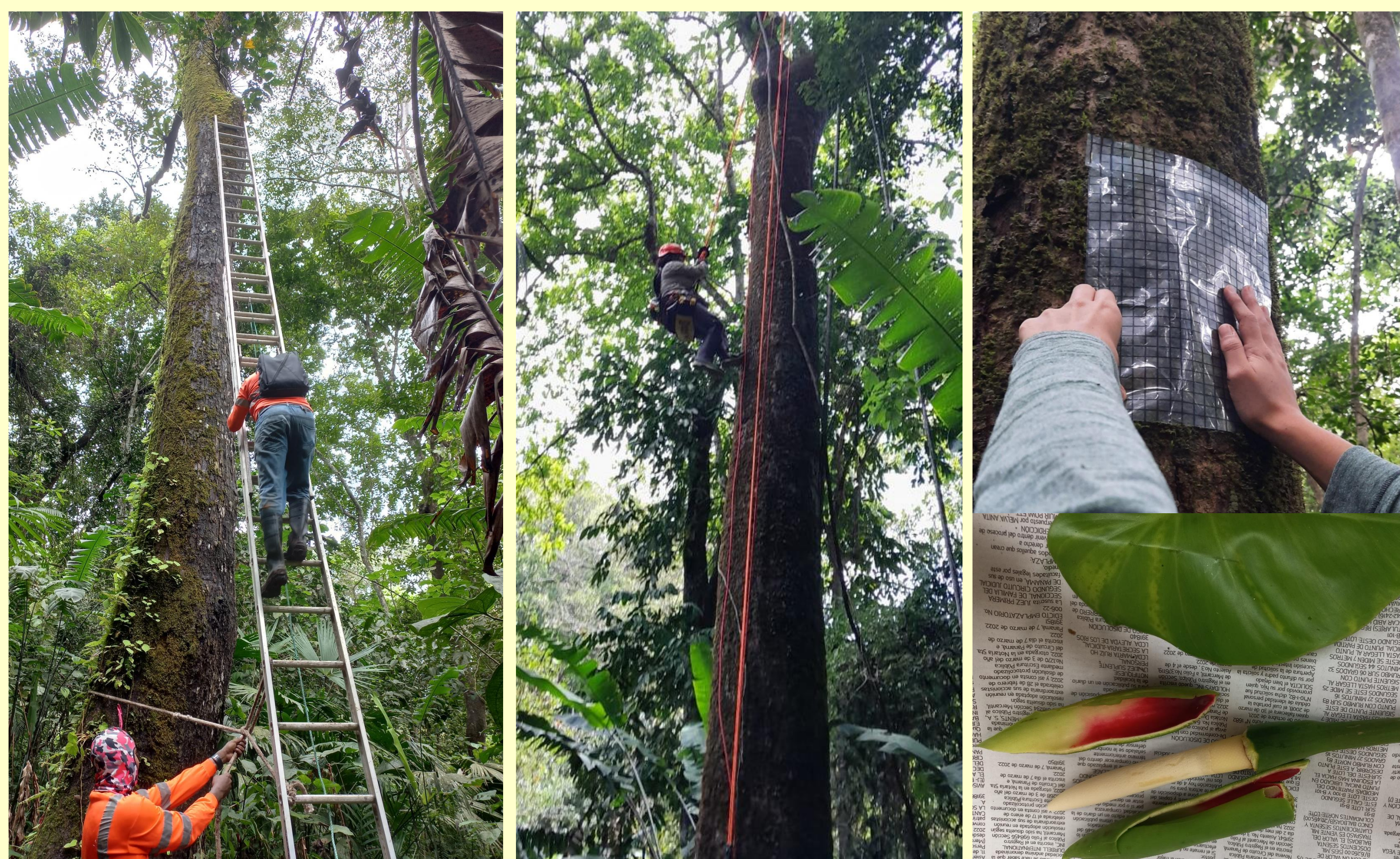
Figura 1. Algunas técnicas de colecta

Se estableció una parcela de trabajo de una hectárea (20m x 500m), en una sección adulta de bosque del PNCC. Se realizaron muestreos y búsquedas al azar [2], [3] de los diferentes grupos de interés briófitas, licófitas, helechos y angiospermas epífitas; durante 29 meses entre agosto de 2021 a diciembre de 2023. Las especies se identificaron con la más actualizada literatura científica.