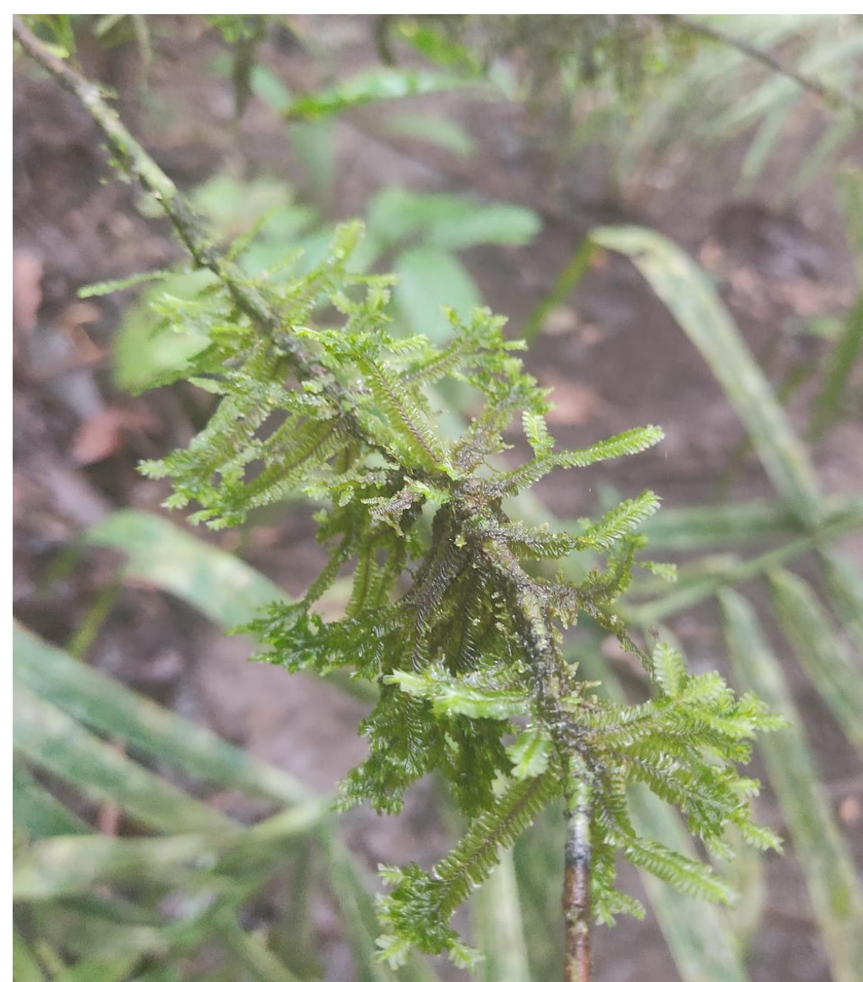
Fig. 2. Plagiochila disticha (Lehm. & Lindenb.) Lehm. & Lindenb.