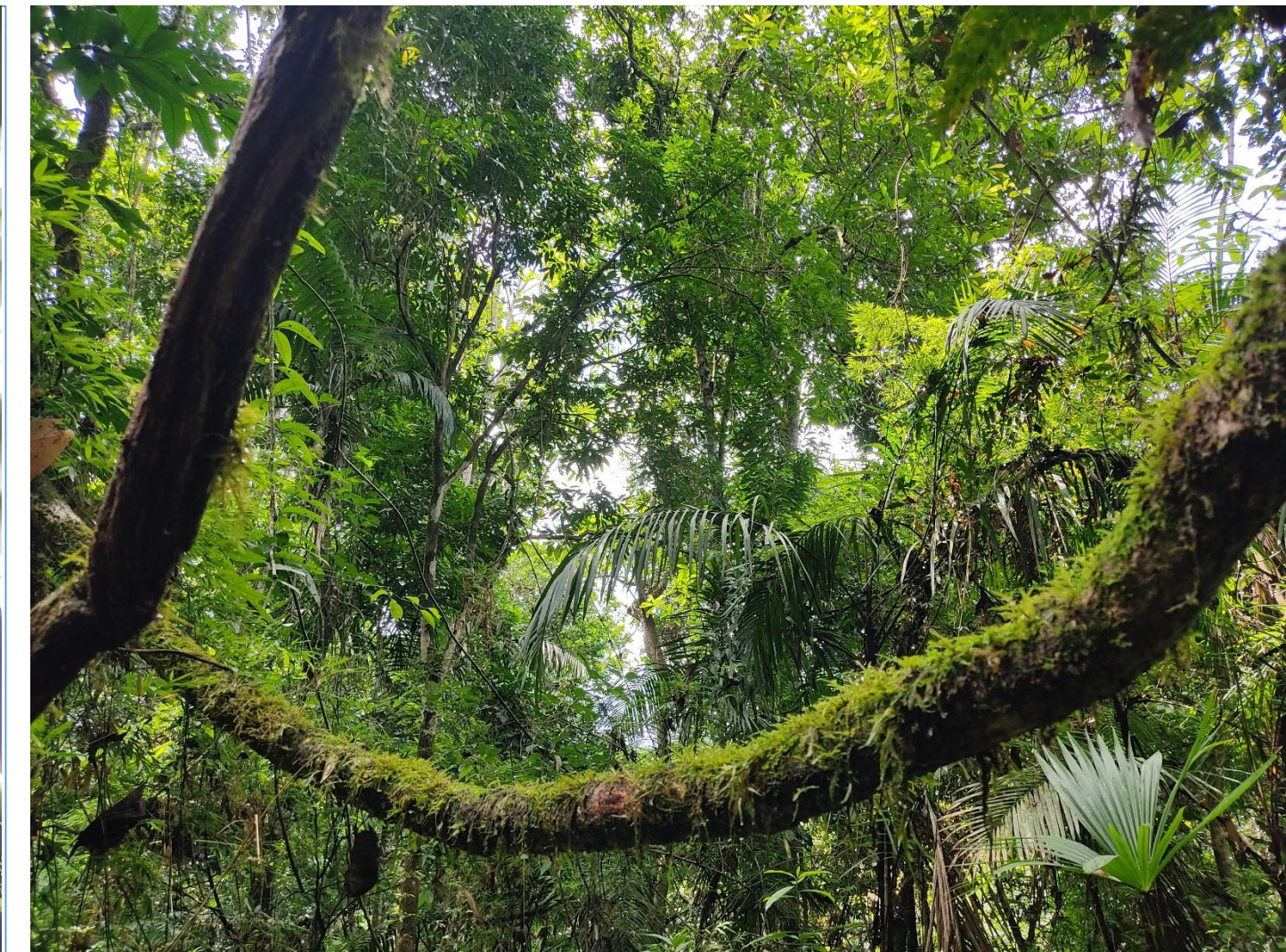
Fig. 5. Ambiente y hábito epífita de las especies en el Parque Nacional Camino de Cruces (PNCC).

La tabla No. 1 compara nuestro esfuerzo inicial realizado hasta esta fecha con estudios publicados (Arrocha et al. , 2020; Gradstein & Salazar 1992; Castroviejo, 1997; Gradstein & Salazar-Allen, 1992; Salazar-Allen et al. , 1991).