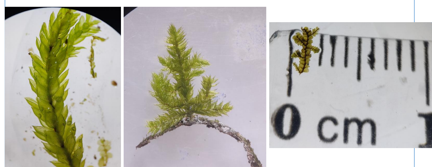
Fig. 3. De izq. a der. Callicostella pallida (Hornsch.) Ångstr.; Pirella pohlii (Schwägr.) Cardot; Trachylejeunea sp.