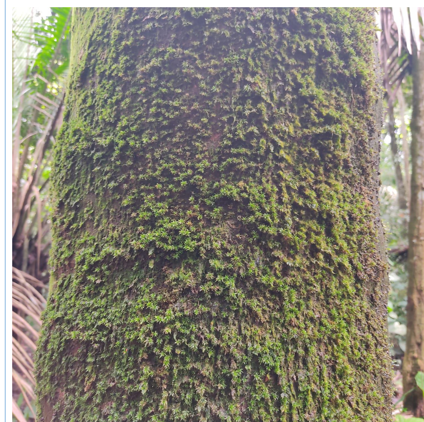
Fig. 4 Syrrhopodon sp. Calymperaceae dominante en troncos de árboles expuestos al sol.

La tabla No. 1 compara nuestro esfuerzo inicial realizado hasta esta fecha con estudios publicados (Arrocha et al. , 2020; Gradstein & Salazar 1992; Castroviejo, 1997; Gradstein & Salazar-Allen, 1992; Salazar-Allen et al. , 1991).