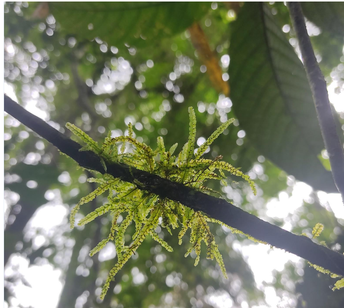
Fig. 1. Neckeropsis undulata (Hedw.) Reichardt. Primera especie reportada presente en el PNCC.