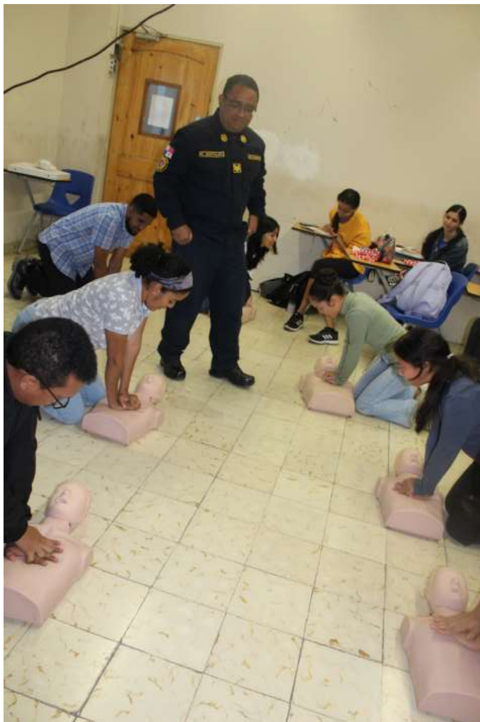
Figura 5. Práctica de Resucitación Cardio-Pulmonar (RCP) con equipo provistos por la Academia de Formación de los Cuerpos de Bomberos en la Universidad de Panamá. 18/3/24