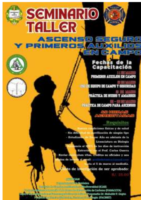
Figura 15. Anuncio del seminario taller.

2024: "Año de la política agroalimentaria a 60 años de la gesta patriótica del 9 de enero" Ciudad Universitaria Octavio Méndez Pereira, Ap. postal 0824-00077, Panamá, Rep. de Panamá Tels.: +507 523-6296; 5238; cel.: +507 6349-8512 correo electrónico carlos.guerrat@up.ac.pa