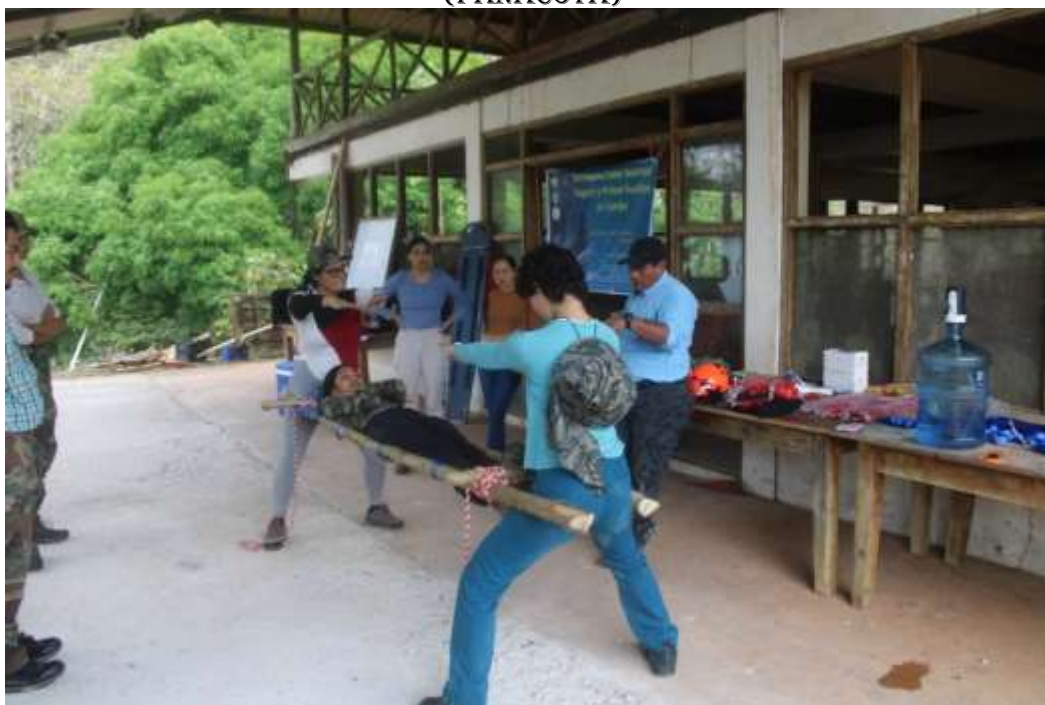
Figura 12. Práctica de encamillaje con cuerdas y extracción. Altos de Río Chagres, Corregimiento de Chilibre, Panamá. 26/3/2024