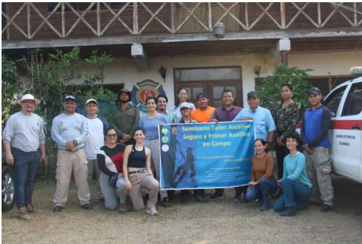
Figura 14. Foto de culminación del Seminario Taller Ascenso Seguro y Primeros Auxilios en Campo. 11-26 de marzo de 2024. Altos de Río Chagres, Corregimiento de Chilibre, Panamá. 26/3/2024