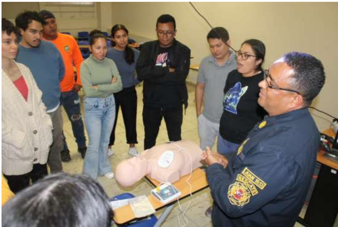
Figura 6. Práctica de aplicación del Desfibrilador Externo Automático (DEA) con equipos provistos por la Academia de Formación de los Cuerpos de Bomberos en la Universidad de Panamá. 18/3/24