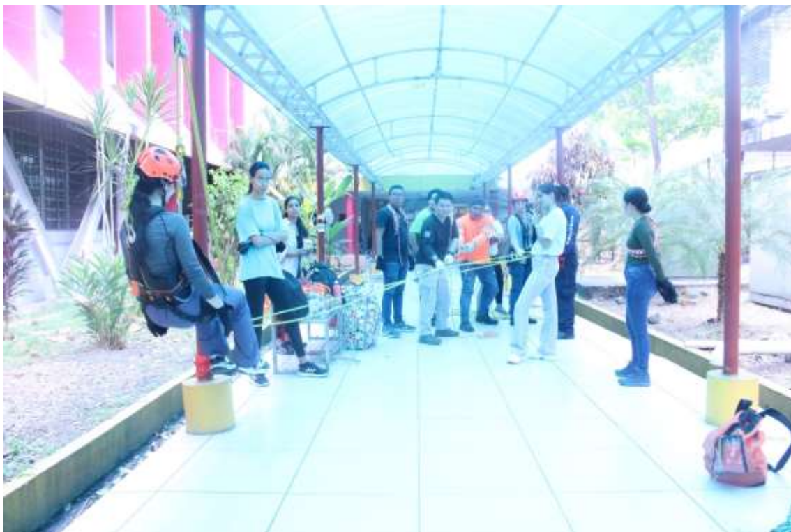
Figura 8. Práctica de uso de nudos, tirolesa y equipos de seguridad durante el ascenso seguro en la Universidad de Panamá. 19/3/2024.