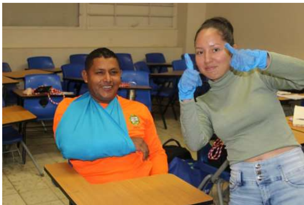
Figura 7. Práctica de control de hemorragia, entablillado e inmovilización de heridas. CBP-UP. 18/3/2024.

2024: "Año de la política agroalimentaria a 60 años de la gesta patriótica del 9 de enero" Ciudad Universitaria Octavio Méndez Pereira, Ap. postal 0824-00077, Panamá, Rep. de Panamá Tels.: +507 523-6296; 5238; cel.: +507 6349-8512 correo electrónico carlos.guerrat@up.ac.pa