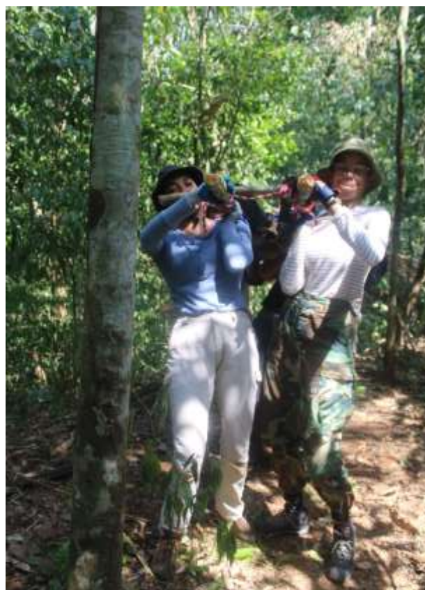
Figura 13. Evaluación del entablillado, inmovilización, encamillaje y extracción. Altos de Río Chagres, Corregimiento de Chilibre, Panamá. 26/3/2024

2024: "Año de la política agroalimentaria a 60 años de la gesta patriótica del 9 de enero" Ciudad Universitaria Octavio Méndez Pereira, Ap. postal 0824-00077, Panamá, Rep. de Panamá Tels.: +507 523-6296; 5238; cel.: +507 6349-8512 correo electrónico carlos.guerrat@up.ac.pa